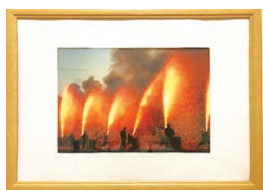
患者様作品「手筒はなび」