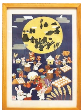
アトリエ幸「お月見」